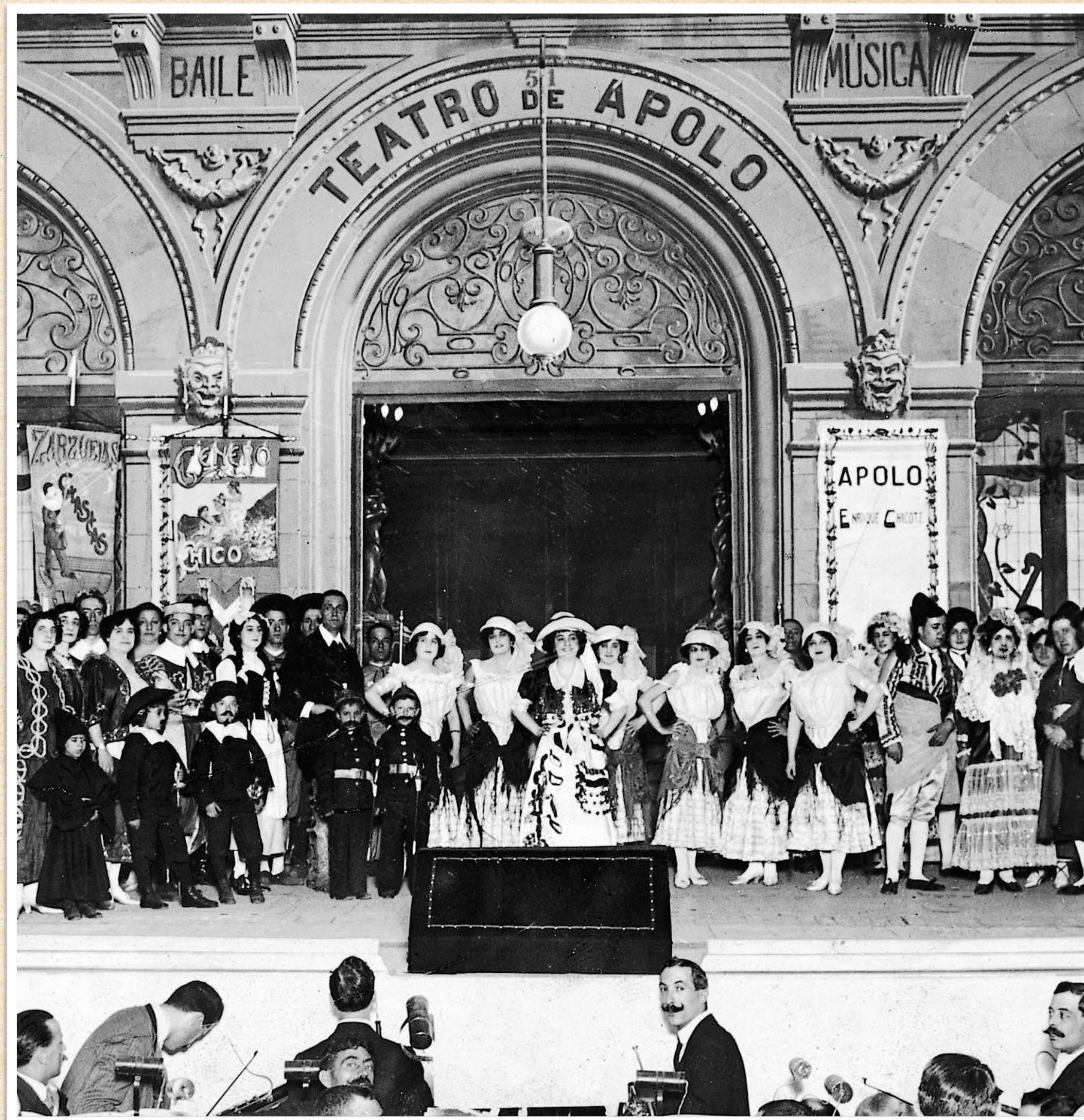
Escena del apropósito La catedral Teatro Apolo, Madrid, 5 de septiembre de 1913.